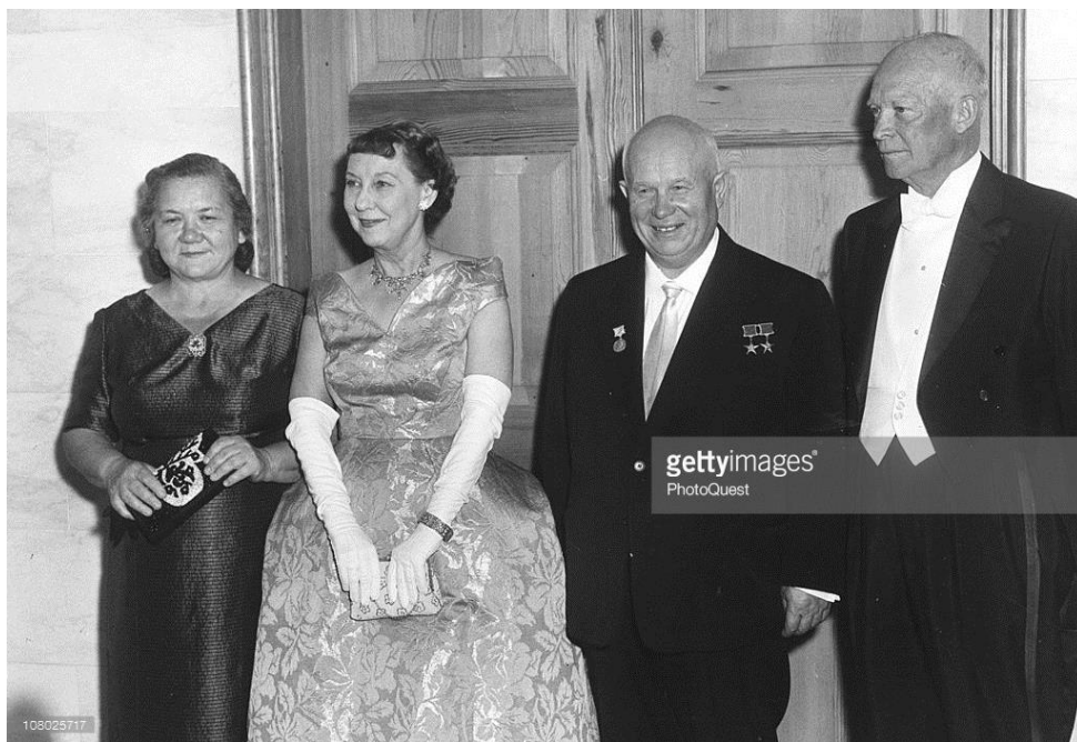
Рисунок А.1 – Чета Хрущевых и президент Эйзенхауэр с супругой. Государственный визит в США. 15 сентября 1959 г. [4]