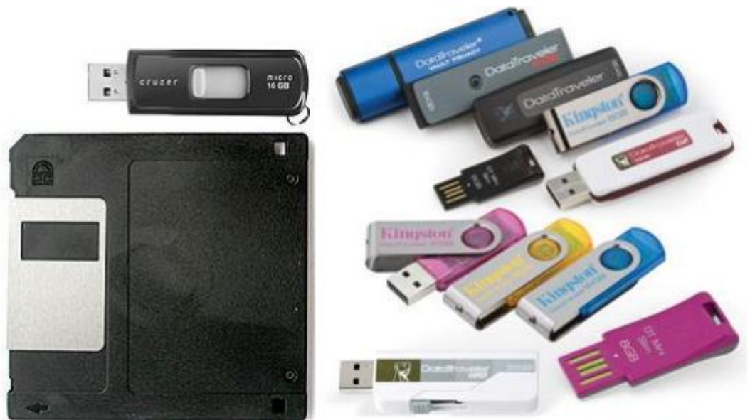
Рисунок 2 - Сравнение размеров носителей информации

USB Flash Drive или USB-накопитель на основе флеш-памяти (флеш-драйв, USB-драйв или «флешка») - носитель информации, использующий флеш-память для хранения данных и подключаемый к компьютеру или иному считывающему устройству через стандартный разъем USB. Именно последнее отличает этот тип носителей информации от карт памяти.