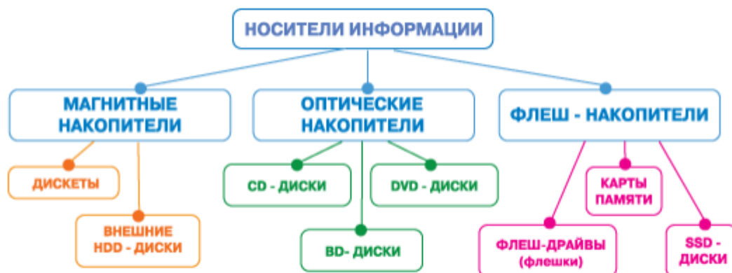
Рисунок 1- Классификация носителей информации

Магнитные носители информации используются в современных ЭВМ для запоминания, хранения значительных объёмов информации при решении задач в области учёта, планирования, экономики, науки и техники. К ним относятся магнитные ленты, диски, барабаны, карты, карты памяти.