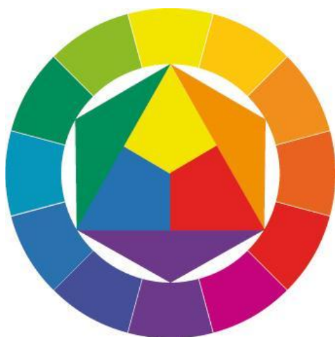
Цветовой Круг И. Иттена