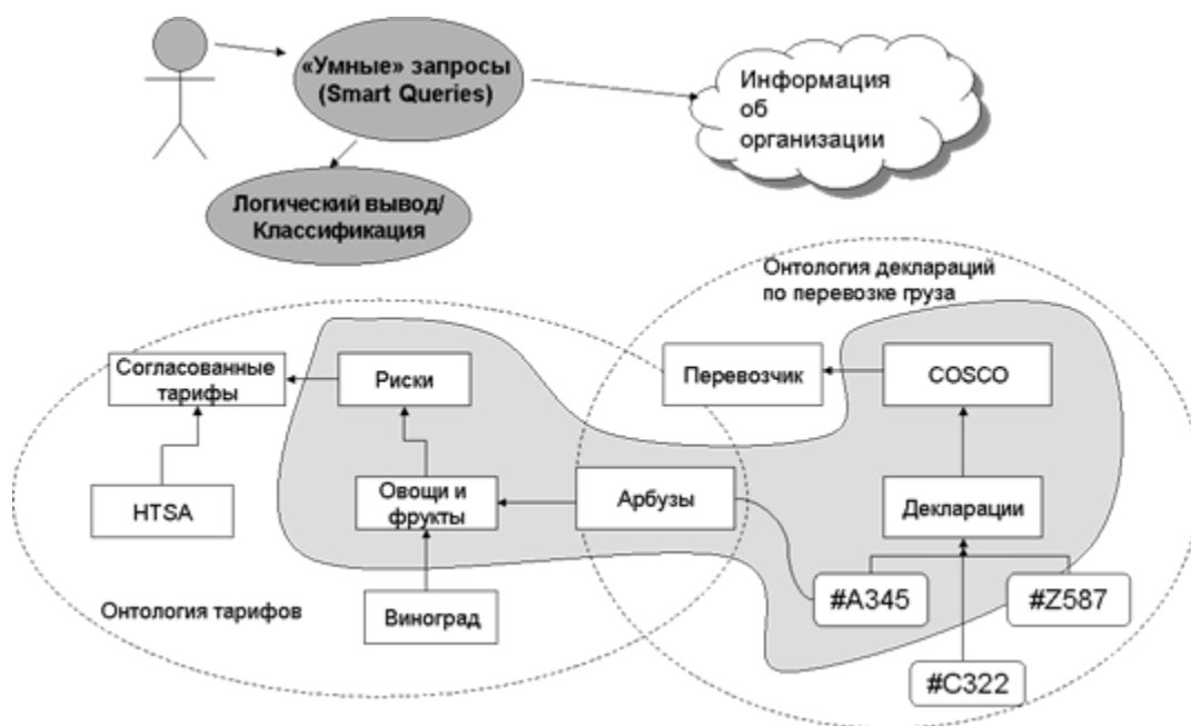
Рисунок 3 Интеллектуальный поиск на основе логического вывода