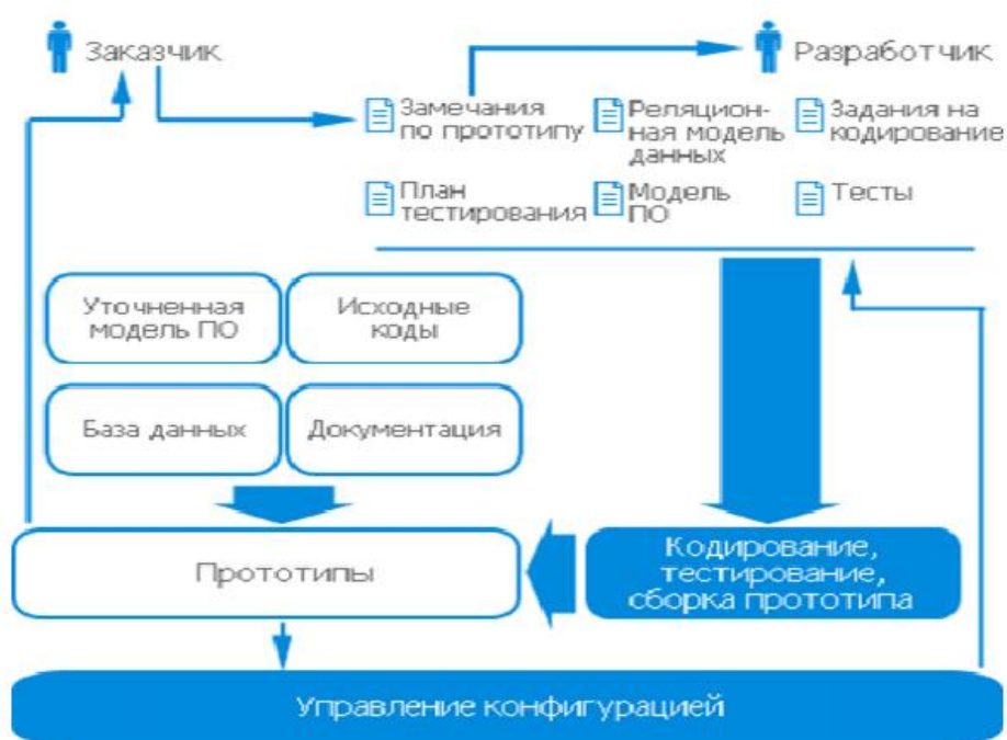
Рисунок 1. Структуру метода прототипирования

Используйте структуру метода прототипирования, представленного на рисунке 1.