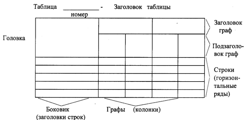
Рис. 1. Пример оформления таблицы

Название таблицы, при его наличии, должно отражать ее содержание, быть точным, кратким. Название таблицы помещают над таблицей после ее номера через тире, с прописной буквы (остальные строчные), без абзацного отступа. Надпись «Таблица...» пишется над левым верхним углом таблицы и выполняется строчными буквами (кроме первой прописной) без подчеркивания.