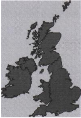
The British Isles