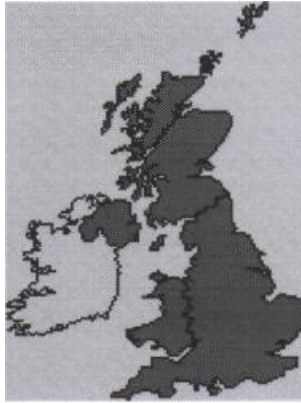
The United Kingdom