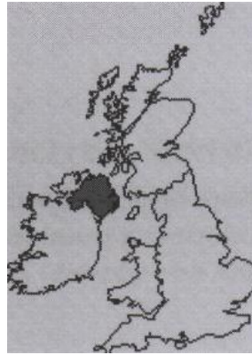
Republic of Ireland