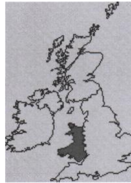
c) Wales _____

10. What are the capitals of Ireland, Republic of Ireland, Northern Ireland?