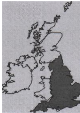
b) England _____