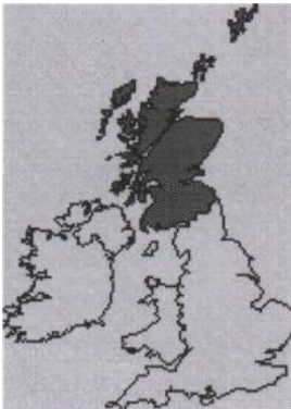
a) Scotland _____

9. What are the capitals of Scotland, England, Wales?