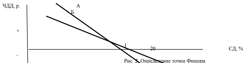
Рис. 2 Определение точки Фишера

При этом строят графики зависимости чистого дисконтированного дохода от ставки дисконта по каждому проекту (линия А и линия Б), в точке их пересечения значение чистого дисконтированного дохода по двум проектам равны. Из этой точки опускаются на ось ставки дисконта, где и получают значение точки Фишера.