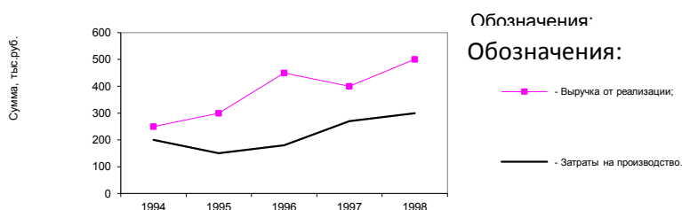
Рисунок 1.2 – Динамика основных технико-экономических показателей

На все иллюстрации должны быть даны ссылки в работе. При ссылках на иллюстрации, схемы, графики следует писать «... в соответствии с рисунком 2» при сквозной нумерации и «... в соответствии с рисунком 1.2» при нумерации в пределах раздела. Ссылка также может быть оформлена по типу «(рисунок 1.2)» или «... на рисунке 5.1 - рисунке 5.4».