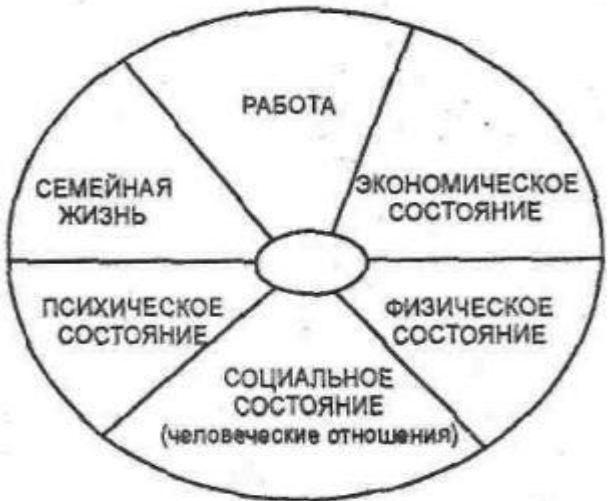
Рис. 1. Примерная структура личного жизненного плана карьеры менеджера