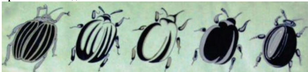
Пример: стилизация животных форм