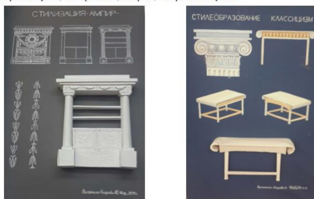
Работы студентов ФИИДБ-12-4 и ФИИДБ-13-4. Руководитель Папилина Л.В.

Задание 2. Выполнить планшет по теме стилеобразование с элементами макетирования. Материалы: гуашь, цв. карандаши, акварель, тонированная бумага.