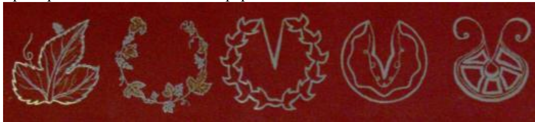
Пример: стилизация растительных форм