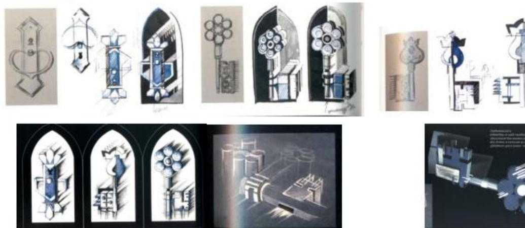
Рис. 10 Дизайн-проект по теме «Средневековье»

Цель работы: Используя стилизацию преобразовать архитектурные средневекового стиля в современный объект средового дизайна. Пример (строгановка).