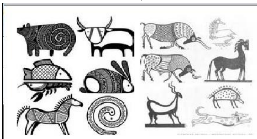
Рис. 4 Пример стилизации животных

Дизайнеры используют различные компьютерные редакторы, преобразующие изображения с помощью инструментов трансформации, которые позволяют делать любой масштаб, вращать, зеркально отражать и искажать рисунок.