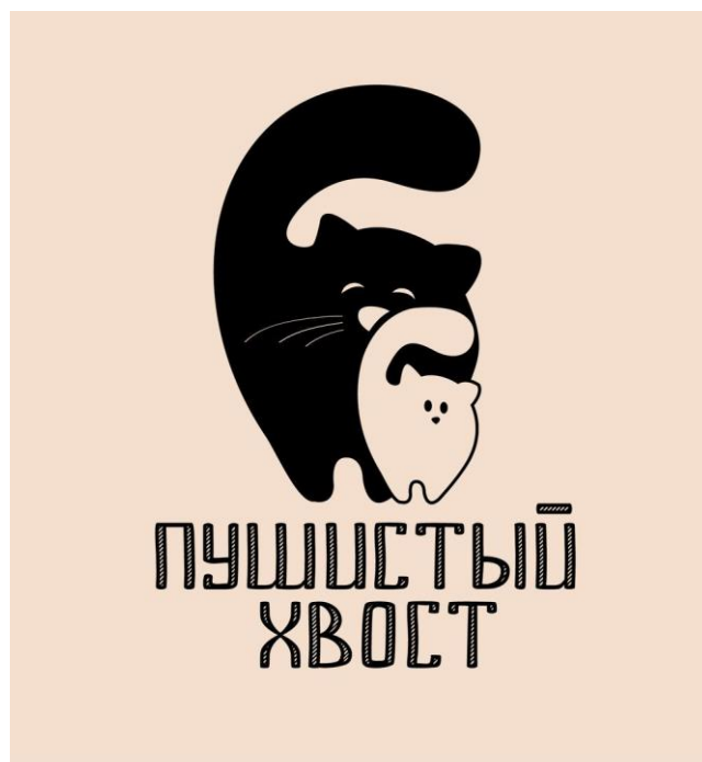
Рис. 3 Стилизация котиков