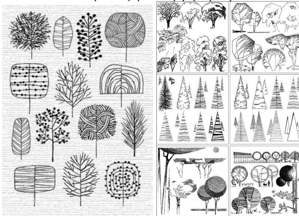
Рис. 2 Пример стилизации деревьев

Использование стилизованных природных образов имеет широкое распространение не только в декоративно-прикладном искусстве, но и в других областях, например, в разработке фирменного стиля. При создании логотипа используются запоминающиеся стилизованные образы природных форм. Объектом может быть любое дерево (фотография или картинка). На формате А 4 сделайте сначала наброски и упростите форму. Пример см. Рис.2