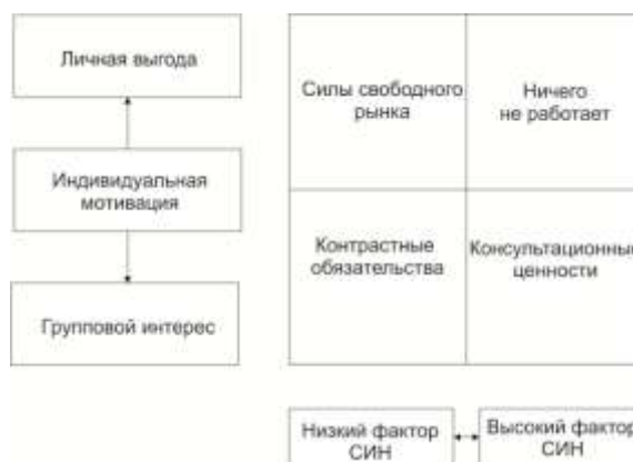
Рисунок 1 – Схема для измерения сложности, изменчивости и неопределенности окружающей среды

Составляют простую схему, состоящую из четырех квадратов: