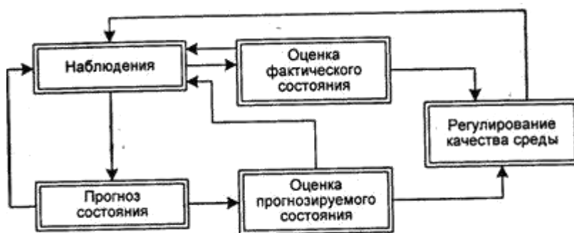
Рис. 2.1. Схема мониторинга

прогноз состояния окружающей среды в результате возможных загрязнений и оценку этого состояния.