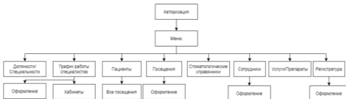
Рисунок3 – Спецификация программы

Программное обеспечение учета стоматологических услуг представлено ниже в виде схемы модулей (рис. 3).