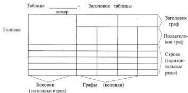
Рисунок 7 - Пример оформления таблицы

Таблицы применяют для лучшей наглядности и удобства сравнения показателей и, как правило, оформляются в соответствии с рисунком 7.