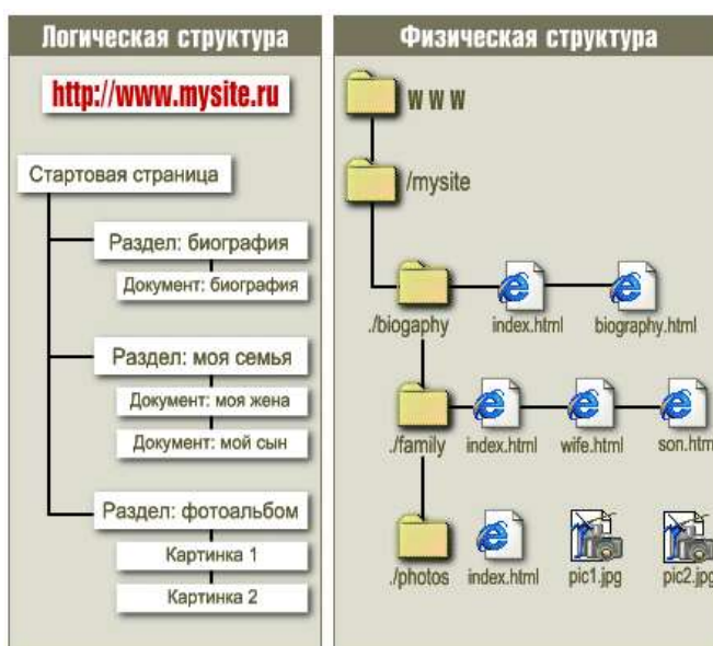
Рисунок 3 – Логическая и физическая структура сайта

Пример сравнения логической и физической структур одного и того же ресурса Интернета показан на рисунке