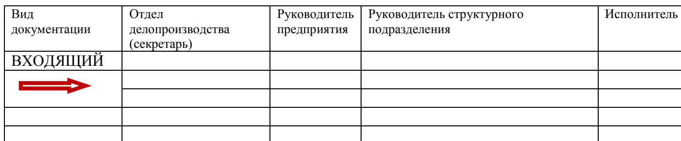
Схема работы с входящим документом

2.2. Вы получили входящий документ после рассмотрения руководителем организации, где в резолюции было указано задание подготовить ответный документ (письмо)