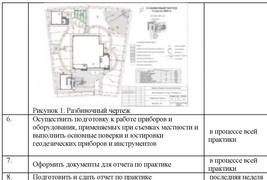
Рисунок 1. Разбивочный чертеж

Примерный перечень документов, прилагаемых в качестве приложений к отчету по практике: