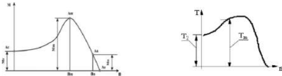
Рисунок 8 – График зависимости