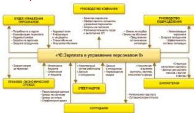
Рисунок 7 - Схема «1С: Зарплата и управление персоналом»