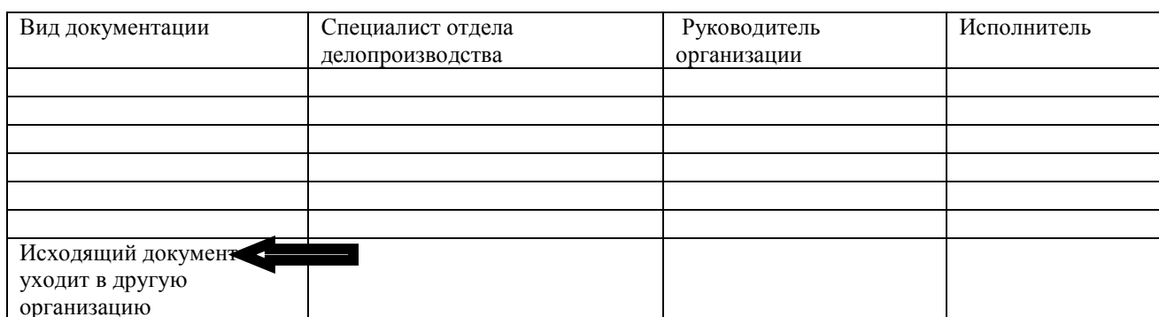
Схема работы с исходящими документами

2.3. Вы являетесь исполнителем по поручению руководителя структурного подразделения , необходимо подготовить ( ПРИКАЗ).