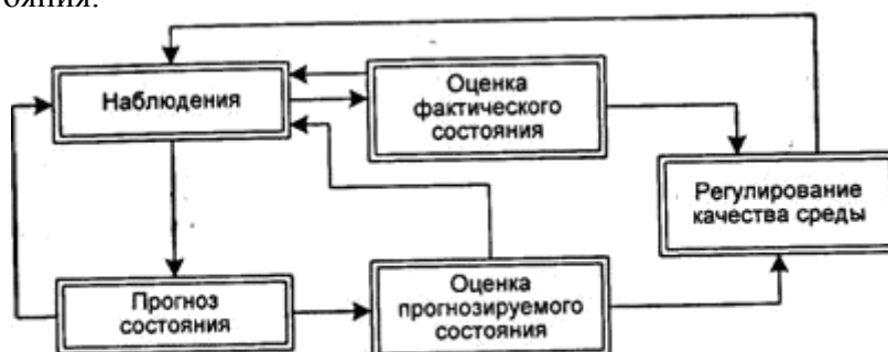
Рис. 2.1. Схема мониторинга

прогноз состояния окружающей среды в результате возможных загрязнений и оценку этого состояния.