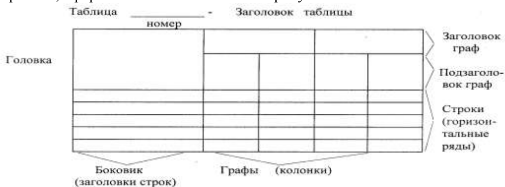
Рисунок 1 – Пример оформления таблицы

5.5.1 Таблицы применяют для лучшей наглядности и удобства сравнения показателей и, как правило, оформляются в соответствии с рисунком 1.