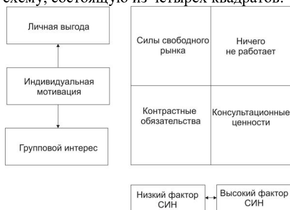
Рисунок 2 – Схема для измерения сложности, изменчивости и неопределенности окружающей среды

Составляют простую схему, состоящую из четырех квадратов: