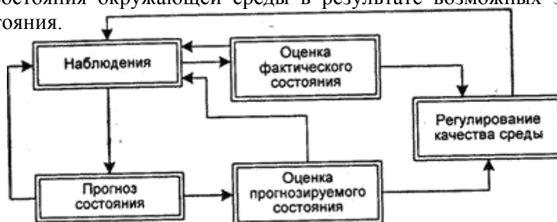
Рис. 2.1. Схема мониторинга

прогноз состояния окружающей среды в результате возможных загрязнений и оценку этого состояния.