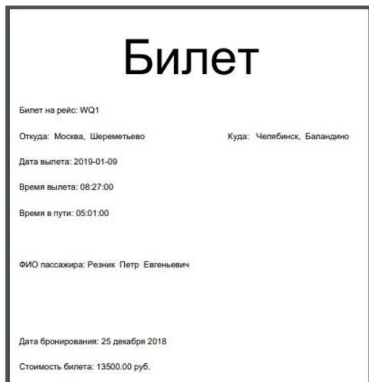
Рисунок 5 – Пример вывода отчета в PDF