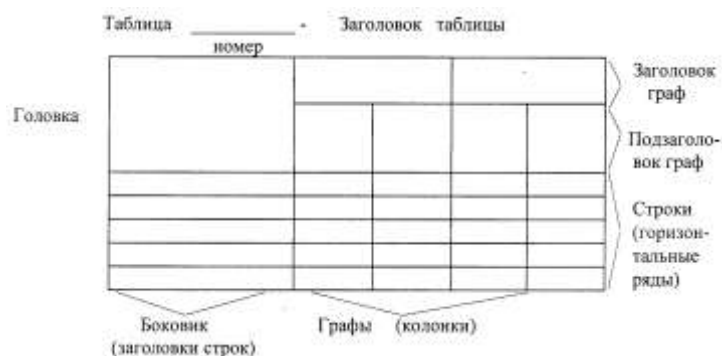
Рисунок 7 - Пример оформления таблицы

Таблица помещается в тексте сразу же за первым упоминанием о ней или на следующей странице.