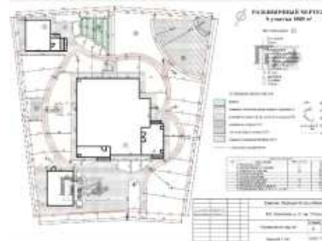
Рисунок 1. Разбивочный чертеж