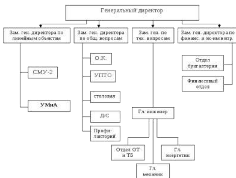
Рисунок 1 –Организационная структура предприятия