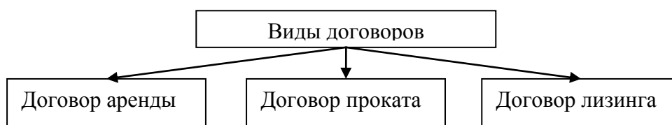
Рисунок 1 - Виды договоров в зависимости от особенностей

Формулы следует выделять из текста в отдельную строку. Выше и ниже каждой формулы или уравнения должно быть оставлено не менее одной свободной строки. Формулы должны приводиться в общем виде с расшифровкой входящих в них буквенных значений. Пояснение значения символов и числовых коэффициентов, входящих в формулу, должны быть приведены непосредственно под формулой. Значение каждого символа дают в той последовательности, в какой они приведены в формуле. Первая строка расшифровки должна начинаться со слова «где» без двоеточия после него.