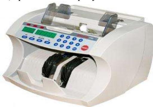
Рисунок 1 - Счетчики банкнот DoCash 3100 SD/UV

Наглядный пример приборов, используемых в Банках для визуального контроля признаков подлинности банкнот, представлен на рисунке 1.