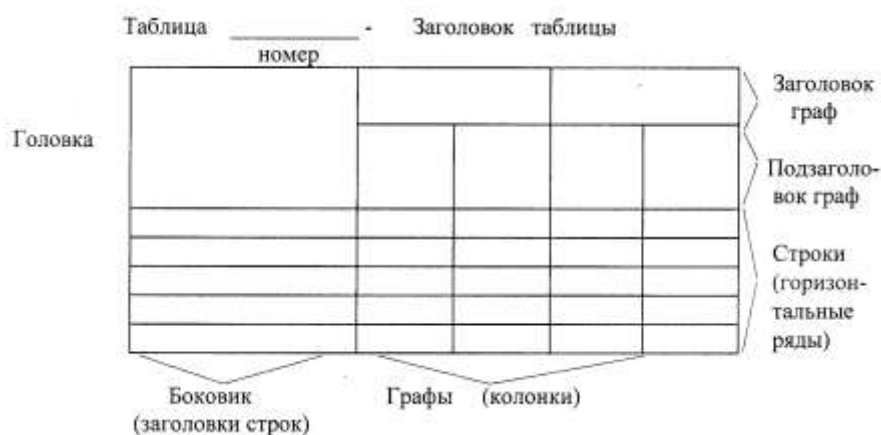
Рисунок 1 – пример оформления таблиц

Таблицы применяют для лучшей наглядности и удобства сравнения показателей и, как правило, оформляются в соответствии с рисунком 1.