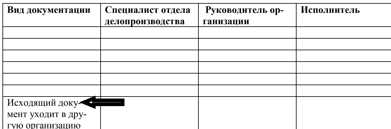
Схема работы с исходящими документами

3.4. Установите этапы работы с внутренним документом. Распределите этапы по схеме и соедините их стрелками.