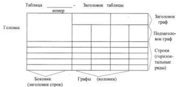
Рисунок 7 - Пример оформления таблицы

Таблица помещается в тексте сразу же за первым упоминанием о ней или на следующей странице.