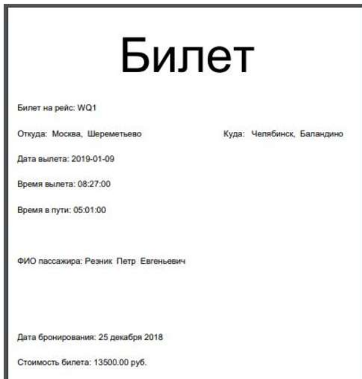
Рисунок 5 – Пример вывода отчета в PDF

Создание отчетов должно сопровождаться обоснованием их целесообразности и необходимости. Отчетом считается любой выходной документ с расширением .docx, .xlsx, .pdf(рис.5)