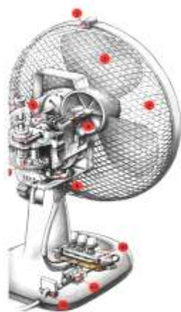
Рис. 3 Вентилятор