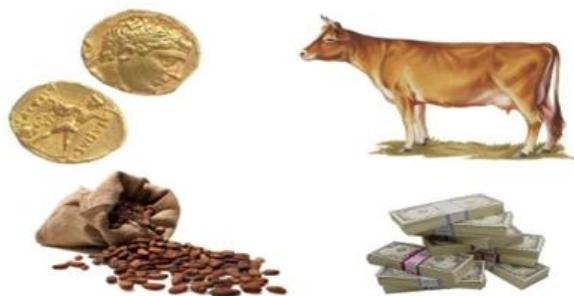
Рисунок. Пример применения денег в истории

Задание 3. Определите какому этапу развития денег соответствуют изображения на рисунке