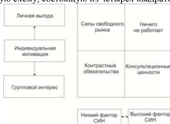
Рисунок 2 – Схема для измерения сложности, изменчивости и неопределенности окружающей среды

Составляют простую схему, состоящую из четырех квадратов: