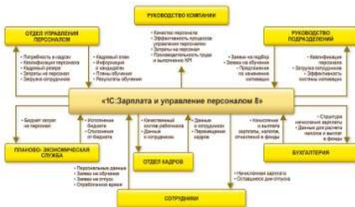
Рисунок 5 – Схема «1С: Зарплата и управление персоналом»