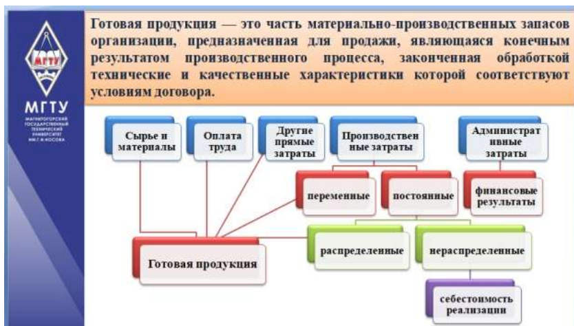
Рисунок 12 – Применение элементов инфографики

Главный принцип инфографики — это визуализация сложной информации таким образом, чтобы она стала проще для восприятия. Инфографика обычно представляет собой красочное изображение с разными информационными блоками, между которыми визуально обозначена связь. Главное — простота и наглядность. В этом формате можно оформить практически любую сложную информацию: годовой или квартальный отчет, систему формирования конечной цены на товар, алгоритм по расчету налога и т.д.