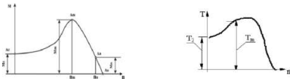
Рисунок б – График зависимости

Графики, по которым можно установить количественную связь между независимой и зависимыми переменными, должны снабжаться координатной сеткой равномерной или логарифмической.