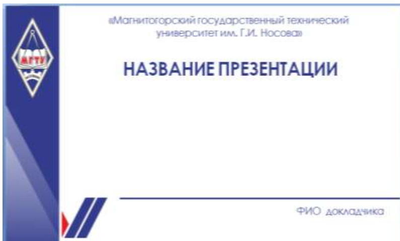
Рисунок 9 – Брендбук МГТУ им. Г.И.Носова

который можно получить по ссылке https://www.magtu.ru/brendbuk/korporativnyj-stil.html (рисунок 9).