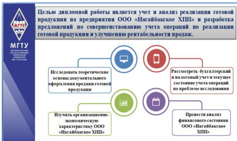
Рисунок 10 – Применение элементов инфографики

Для повышения эффективности презентации рекомендуется использовать элементы инфографики. Наиболее удачные примеры можно увидеть на рисунках 10-13.