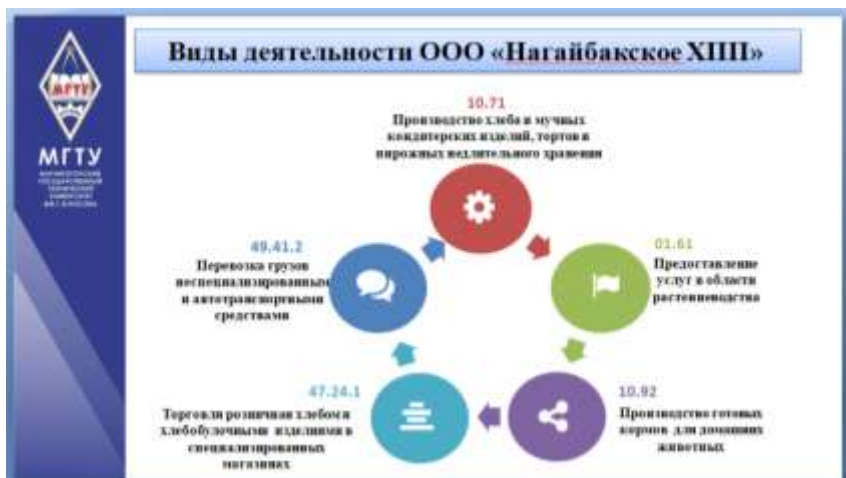
Рисунок 11 – Применение элементов инфографики