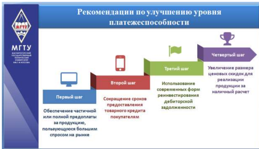
Рисунок 13 – Применение элементов инфографики

На заключительном слайде необходимо сделать выводы по дипломной работе и предложить рекомендации по улучшению эффективности деятельности организации (снижению себестоимости, повышению рентабельности, платежеспособности, деловой активности или финансовой устойчивости). Это можно сделать с помощью элементов инфографики (рисунок 13).