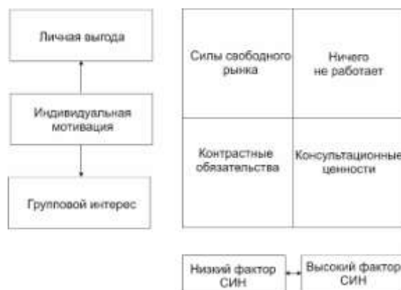
Рисунок 1 – Схема для измерения сложности, изменчивости и неопределенности

Составляют простую схему, состоящую из четырех квадратов: