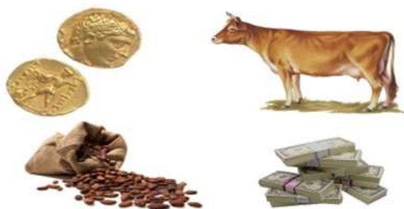
Рисунок. Пример применения денег в истории