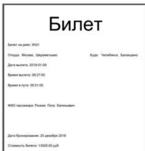
Рисунок 5 – Пример вывода отчета в PDF