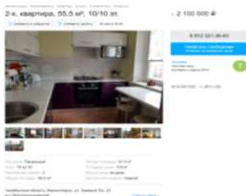
Рисунок 1 Объект аналог 1