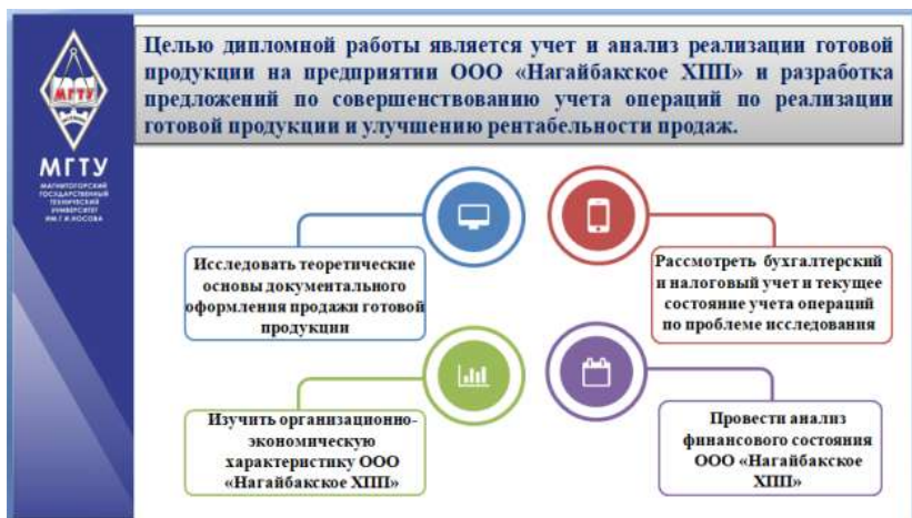
Рисунок 7.2 – Применение элементов инфографики

Для повышения эффективности презентации рекомендуется использовать элементы инфографики. Наиболее удачные примеры можно увидеть на рисунках 7.2-7.4).