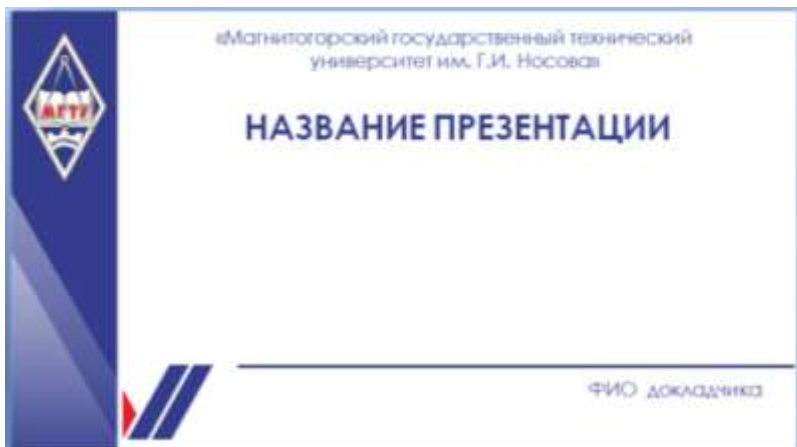
Рисунок 7.1 – Брендбук МГТУ им. Г.И.Носова

Подготовить слайды можно с помощью различных компьютерных программ, наиболее доступная это Microsoft Office PowerPoint. Для оформления презентации целесообразнее использовать брендбук МГТУ (рисунок 7.1)