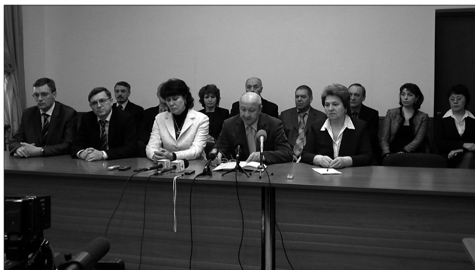
На встрече с журналистами

Ректор продолжил, что, согласно распоряжению Правительства РФ, колледжи войдут в состав университета, став его структурными подразделениями, под единым названием – ГОУ ВПО «МГТУ им. Г.И. Носова». Структура комплекса находится в стадии разработки – министерство не настаивает на спешке, ожидая готовый вариант к лету. Главное здесь – сохранить самобытность СПО в рамках высшего образования. Что касается финансирования, то оно будет состоять из консолидированного бюджета всех объединенных структур с соблюдением интересов каждой из них. Работа по реорганизации объединяемых образовательных учреждений предстоит большая, но уже с нового учебного года комплекс должен стать действующим. Все его выпускники будут получать диплом МГТУ единого