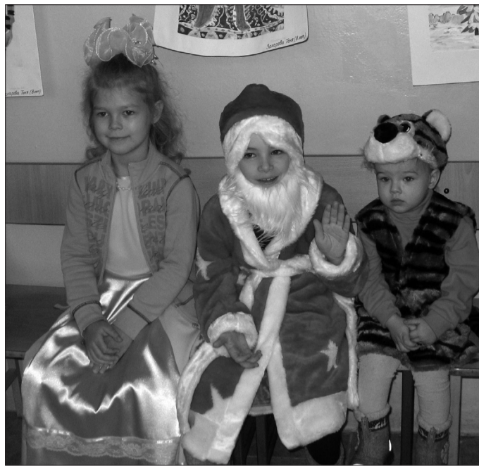
Новогодний праздник на горном факультете