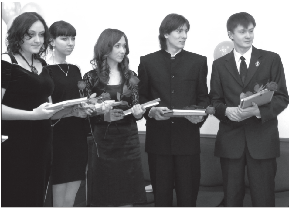
Счастливые обладатели красных дипломов