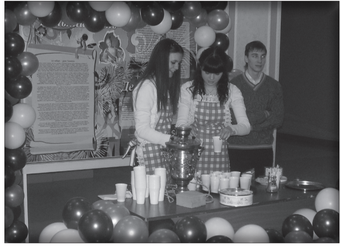
Горячим чаем угощали на «центре»