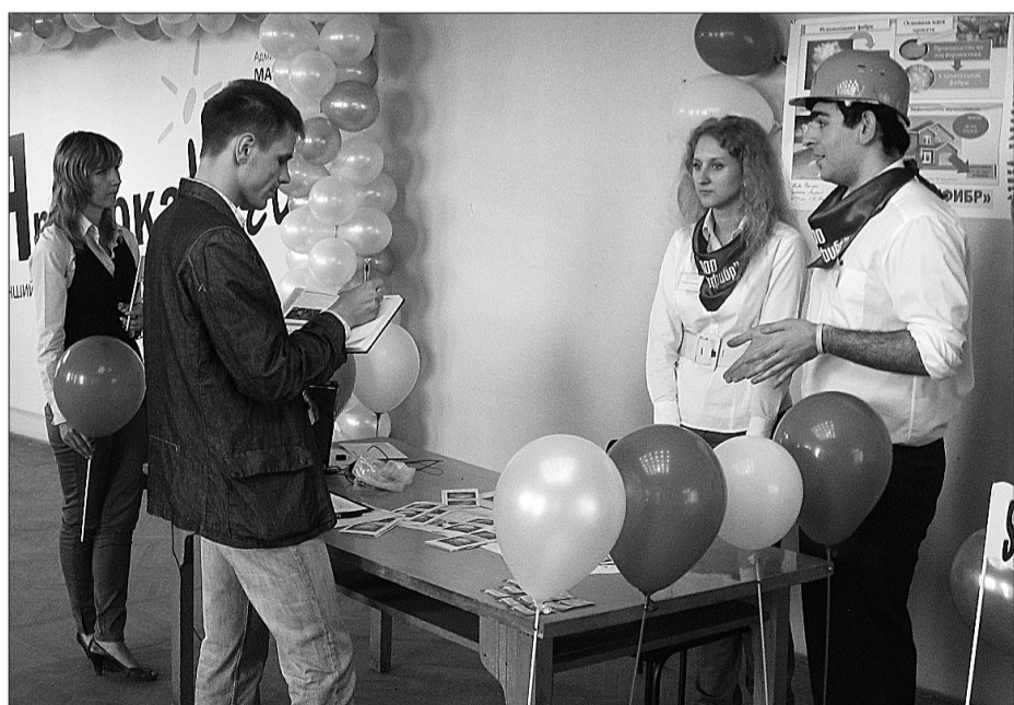
Студенты делятся бизнес-идеями