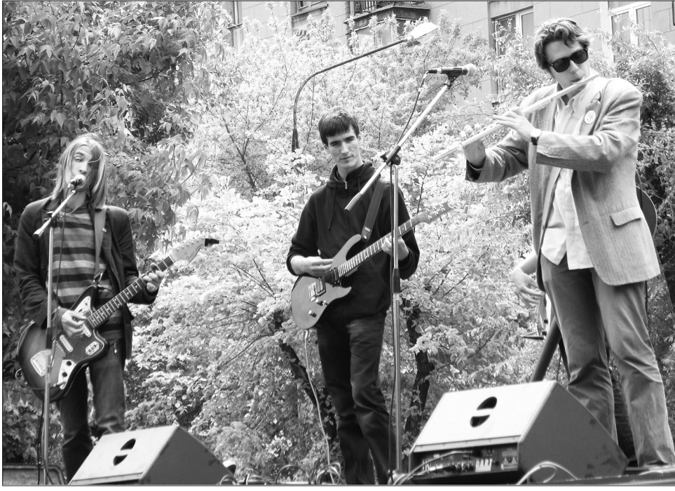
Выступление на концертной площадке

Вначале погода была пасмурная, но студенты МГТУ не испугались и весело провели весь день, наслаждаясь звуками замечательной музыки приглашенных групп и выступлений танцевальных коллективов.