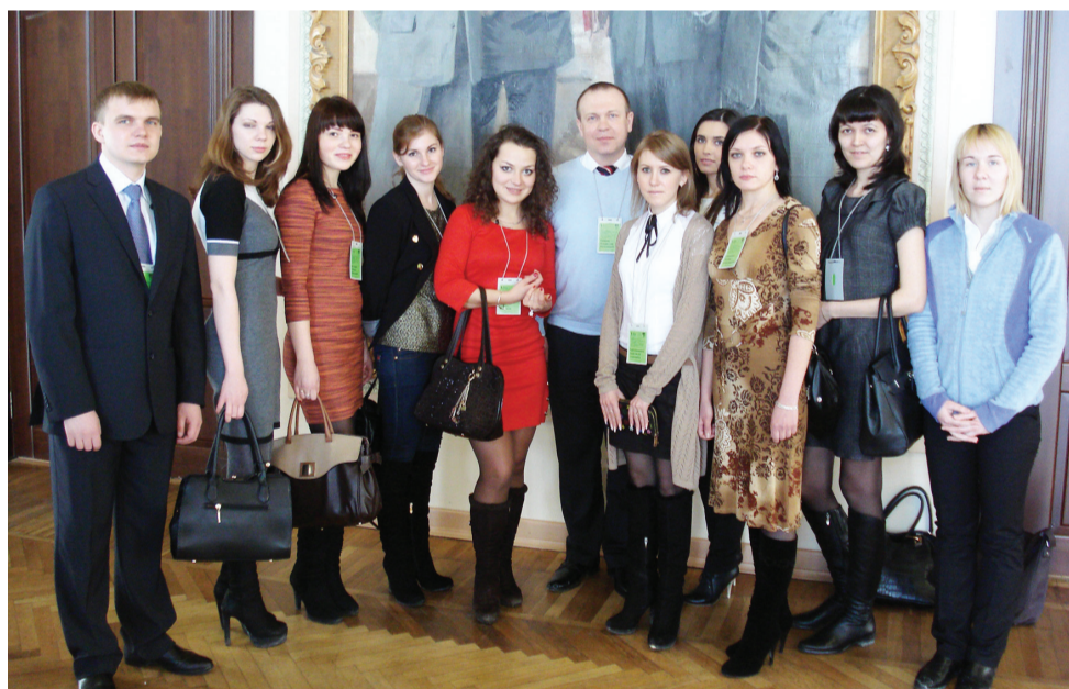
Наши ребята в УрФУ

Работа конференции проводилась в виде секционных заседаний на темы