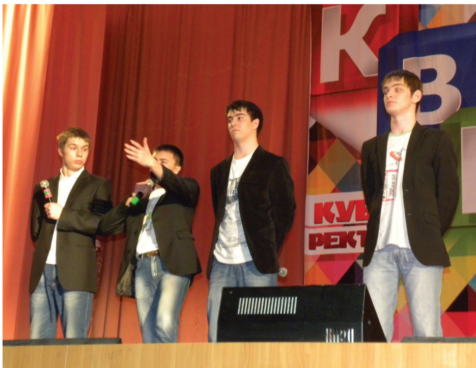
Выступает команда химико-металлургического факультета

Остается пожелать всем участникам КВНа удачно сдать сессию, чтобы во время учебы не возникало никаких проблем, а экзамены и зачеты сдавались быстро и легко. Удачи всем!