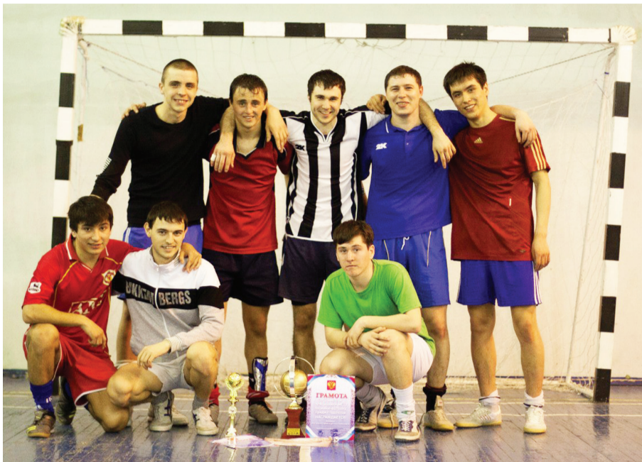
Победители первого турнира