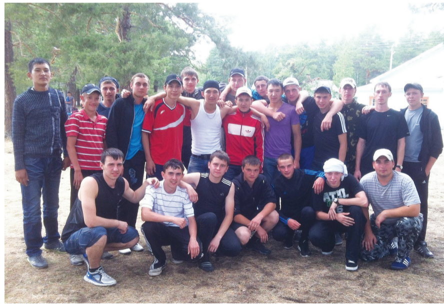
Студенты гр. М-10 УК "С" на военных сборах