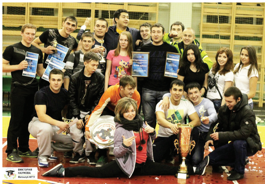
Победители спартакиады – команда общежития № 3

В программе соревнований было четырнадцать видов спорта: перекладина, гиря, волейбол женский, волейбол мужской, баскетбол мужской,