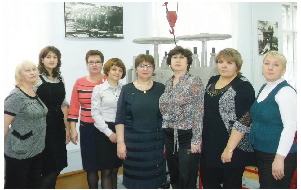
Преподаватели предметно-циклового комиссии «Металлургия и обработка металлов давлением»