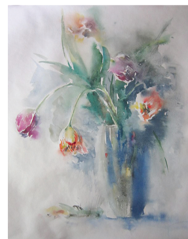
"Тюльпаны", И. Кропотова