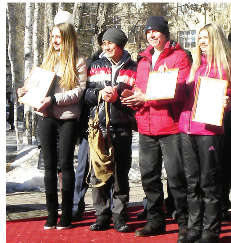
Победители конкурса в номинации «Снежные фигуры»