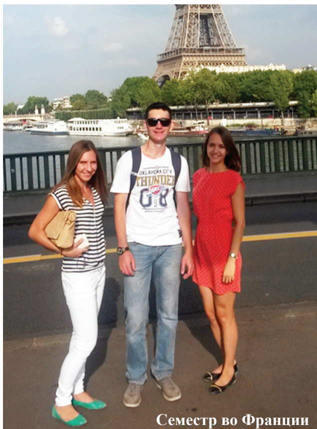
Семестр во Франции