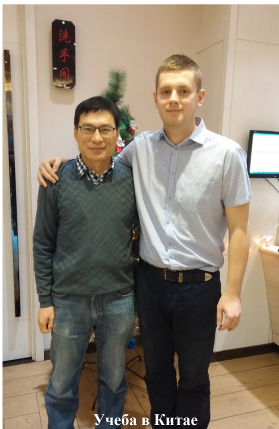
Учеба в Китае