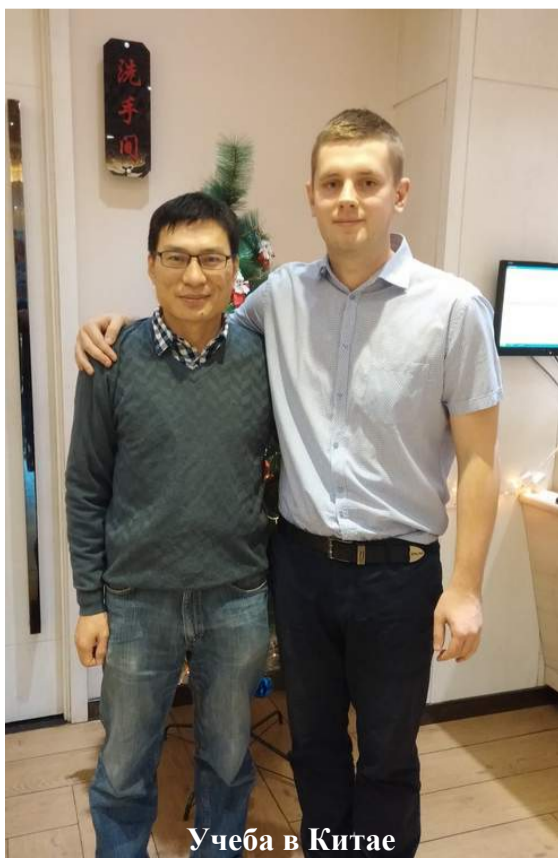
Учеба в Китае